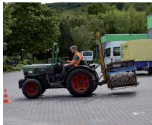
Fahren mit Heckgewichten