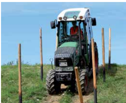
Fahren am Steilhang