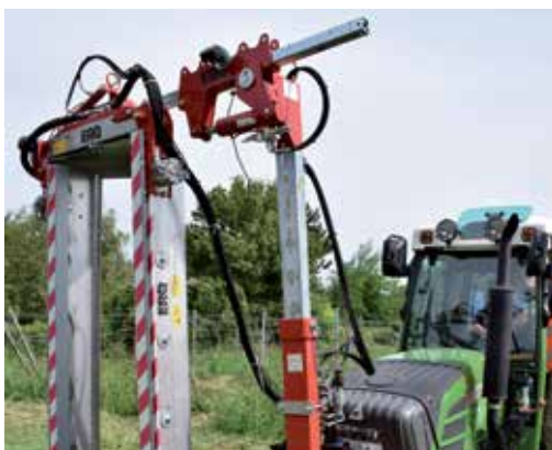
Einsatz von Kameramonitorssystemen