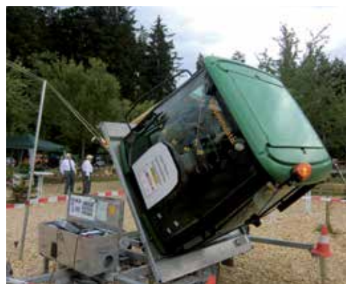
Kippen des Schleppers